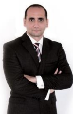
av. Marius Rimboaca

Prevederile anterior mentionate intra in vigoare incepand cu 09.05.2015 .